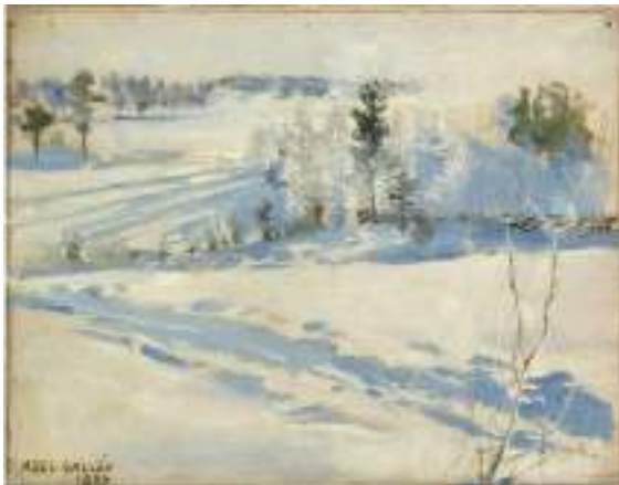
A. Gallén-Kallela, Talvimaaisema (1887)

Hyvää alkanutta vuotta taiteilijat ja taiteen ystävät!