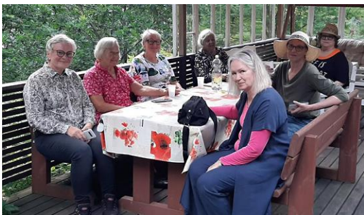
Rehakan pihamaalauspäivän väkeä ja tuloksia